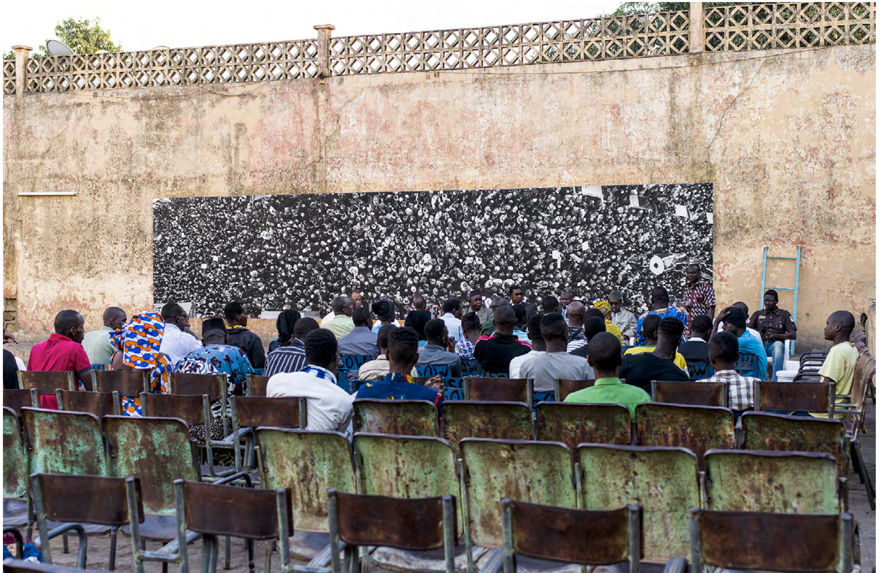
Le rassemblement , Paris, France, 2015