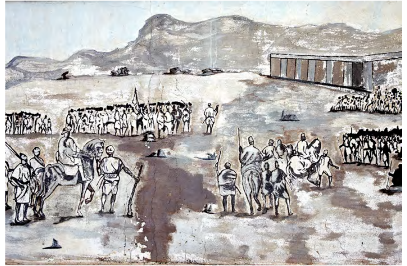
Bataille de Sansanding, 1865, Koulouba, Bamako, Mali, 2013 Mali Militari series