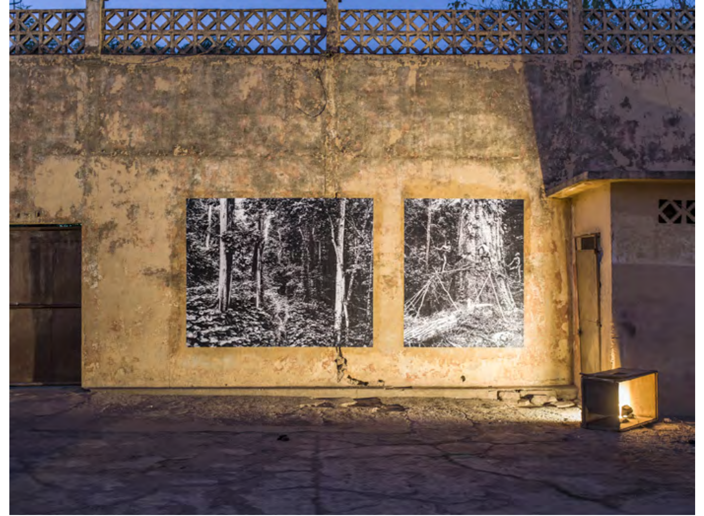
Sao Tomé, Paradox of Paradise series © Nii Obodai Coupe de bois, Côte d'Ivoire, archives, collection François-Xavier Gbré Vue de l'installation au / Installation view at Cinema El Hilal, Medina Coura, Bamako, Mali, 2017