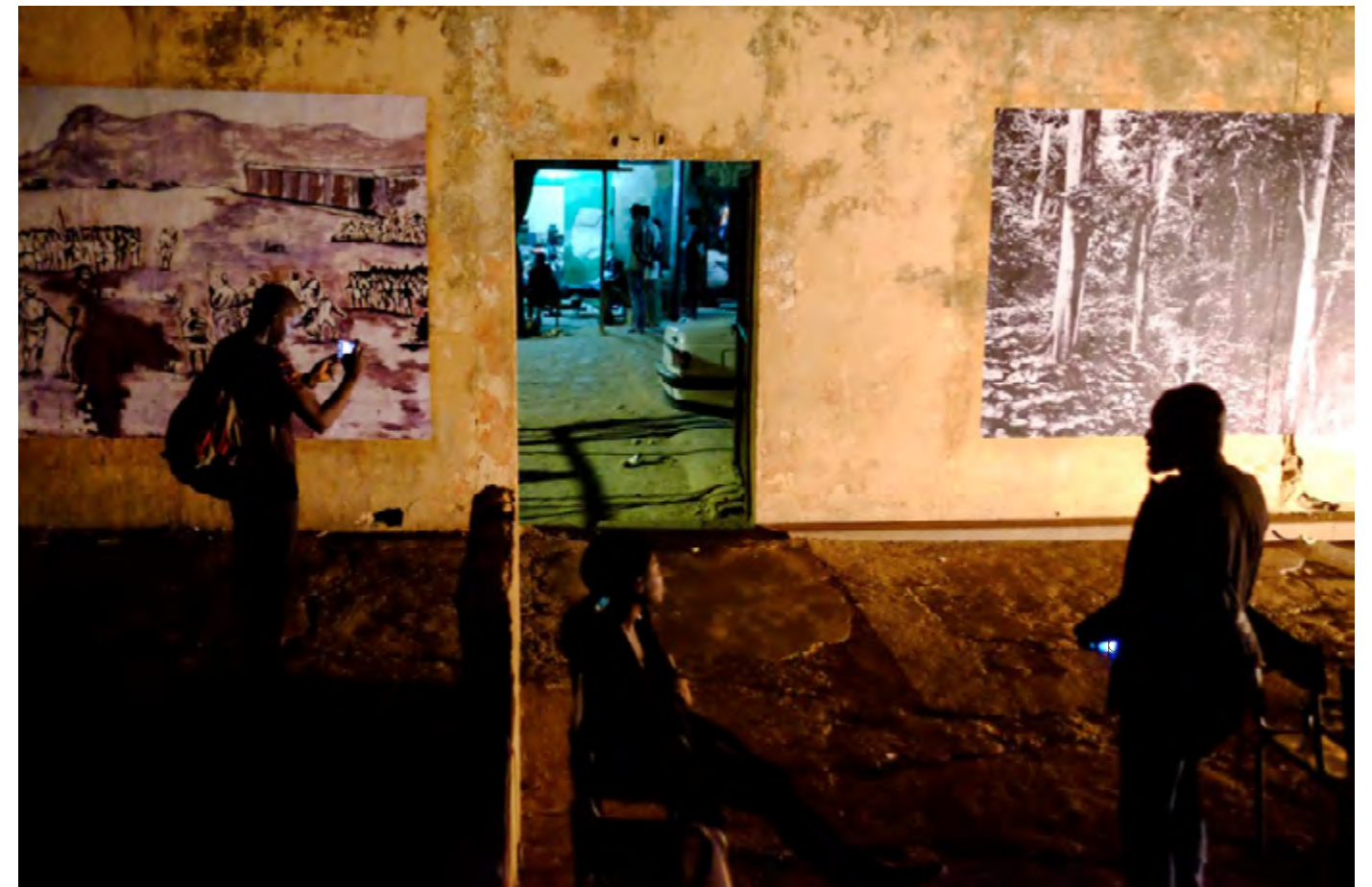
Montage de l'exposition et projections pucliques au / Setting up of the exhibition and public screenings at Cinema El Hilal, Medina Coura, Bamako, Mali, 2017.