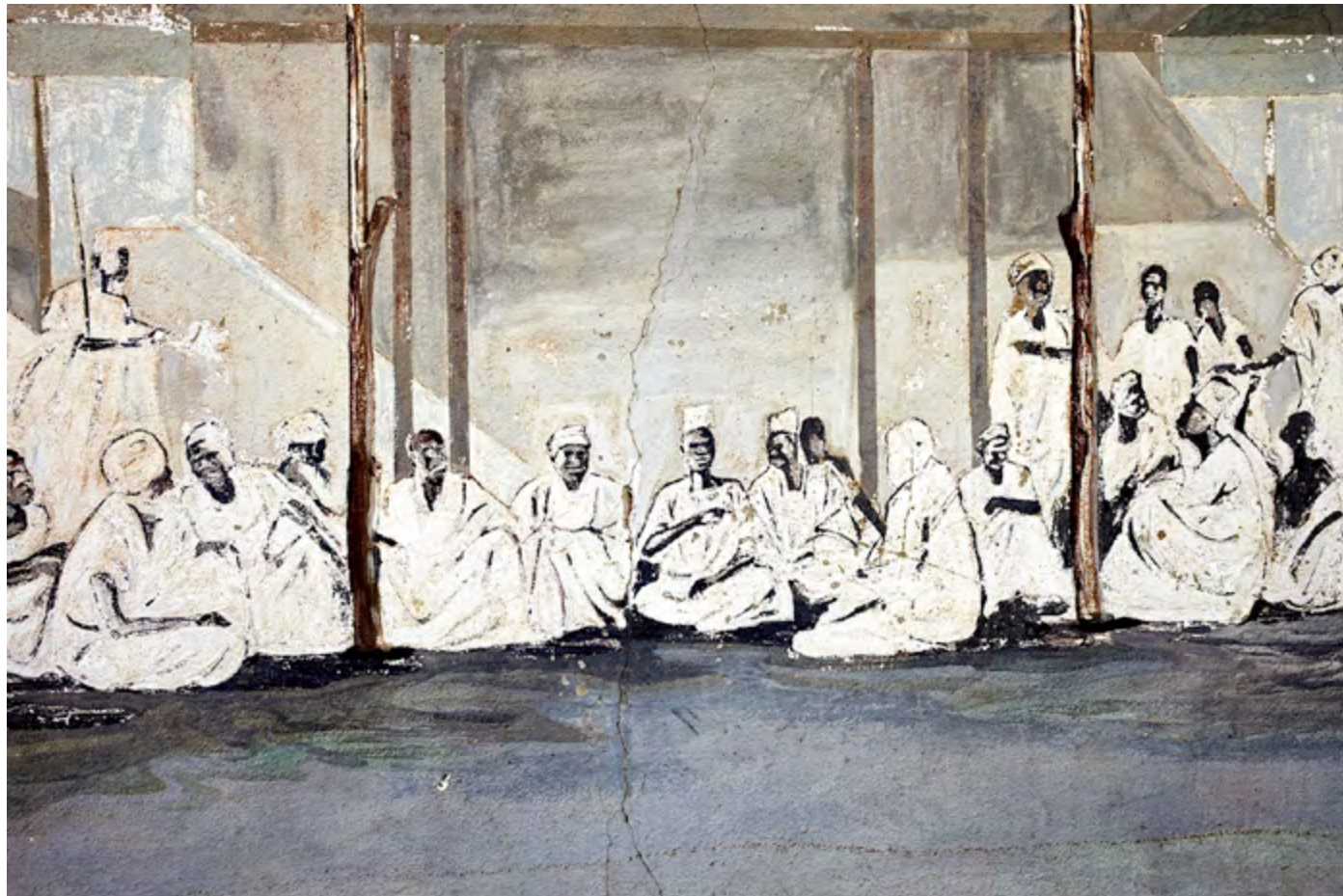
Cour d'Ahmadou Sékou (1776-1844), fondateur de l'Empire Peul du Macina, Koulouba, Bamako, Mali, 2015, Mali Militari series