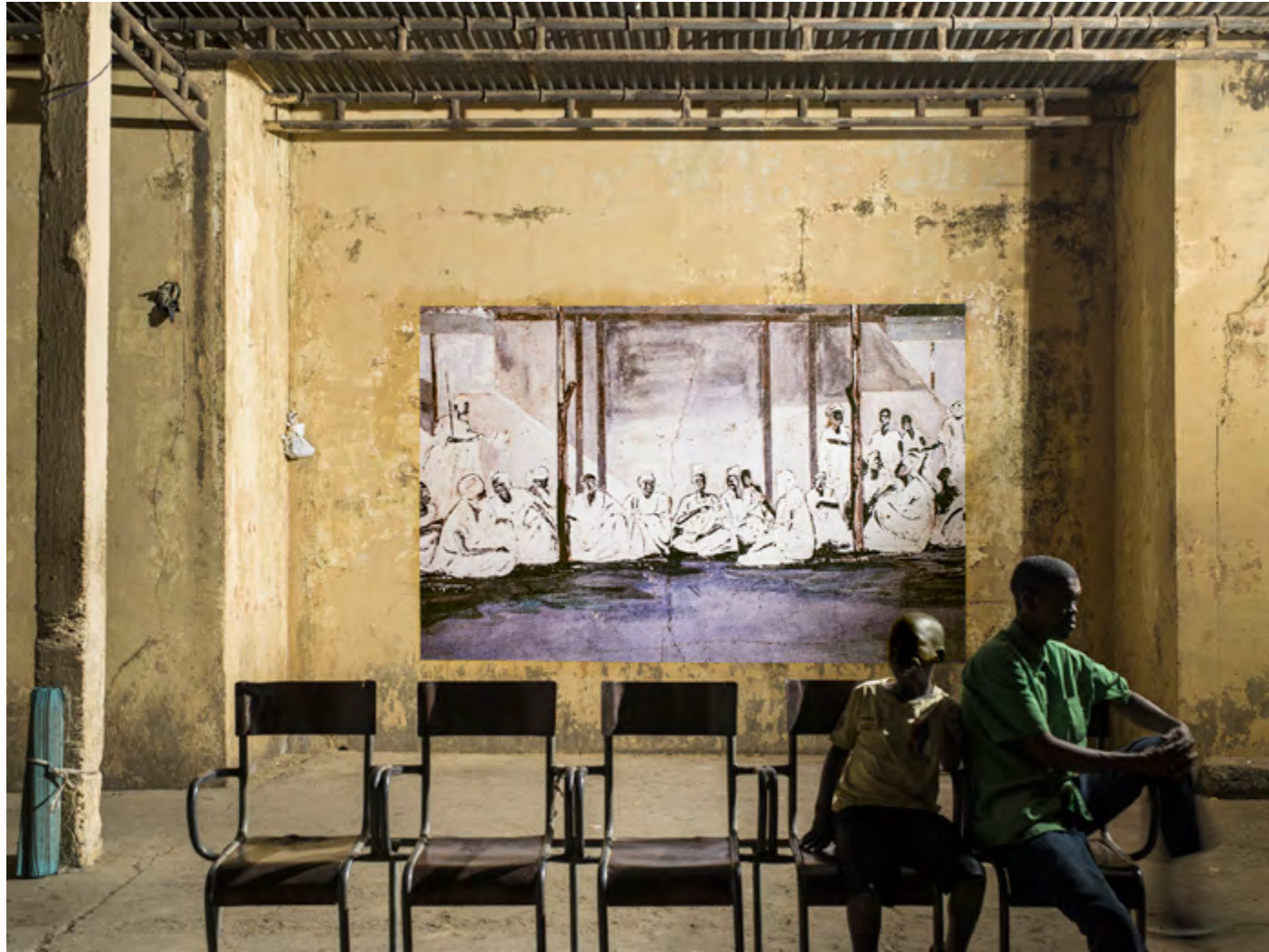
Cour d'Ahmadou Sékou (1776-1844), fondateur de l'Empire Peul du Macina, Koulouba, Bamako, Mali, 2015, Mali Militari series Vue de l'installation au / Installation view at Cinema El Hilal, Medina Coura, Bamako, Mali, 2017