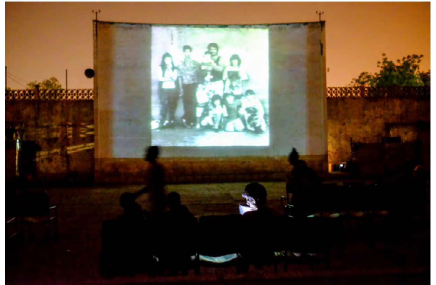
Montage de l'exposition et projections pucliques au / Setting up of the exhibition and public screenings at Cinema El Hilal, Medina Coura, Bamako, Mali, 2017. Photographies / Photographs © Nicolas Rémené © Rija Solo