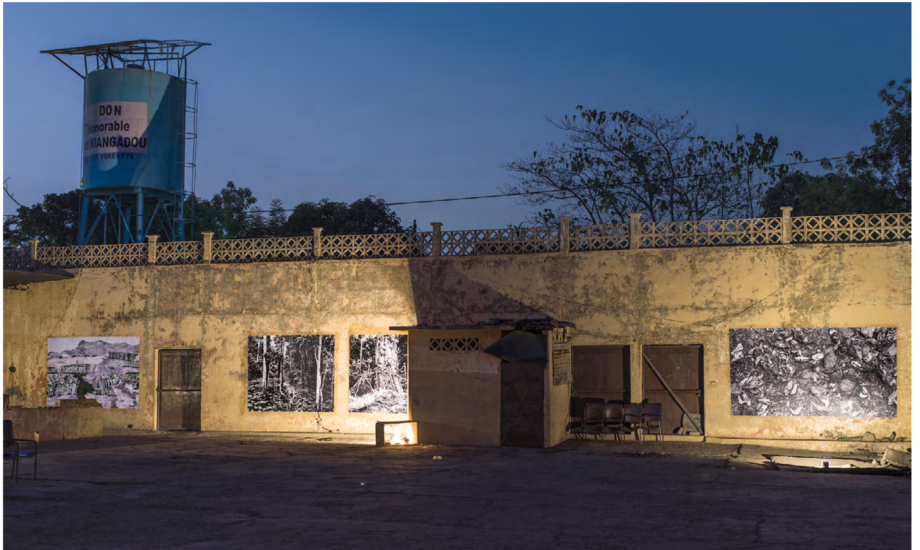
Bataille de Sansanding, 1865, Koulouba, Bamako, Mali, 2013, Mali Militari series © François-Xavier Gbré