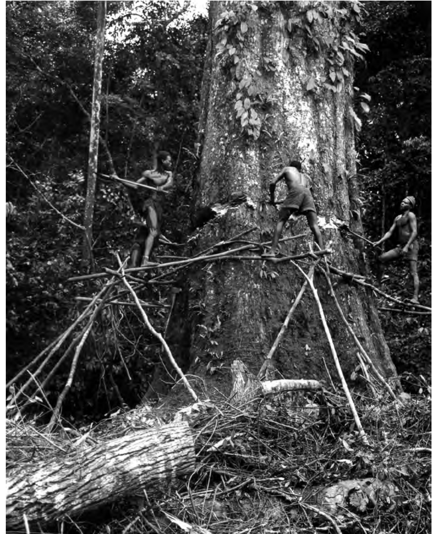
Coupe de bois, Côte d'Ivoire, archives, collection François-Xavier Gbré