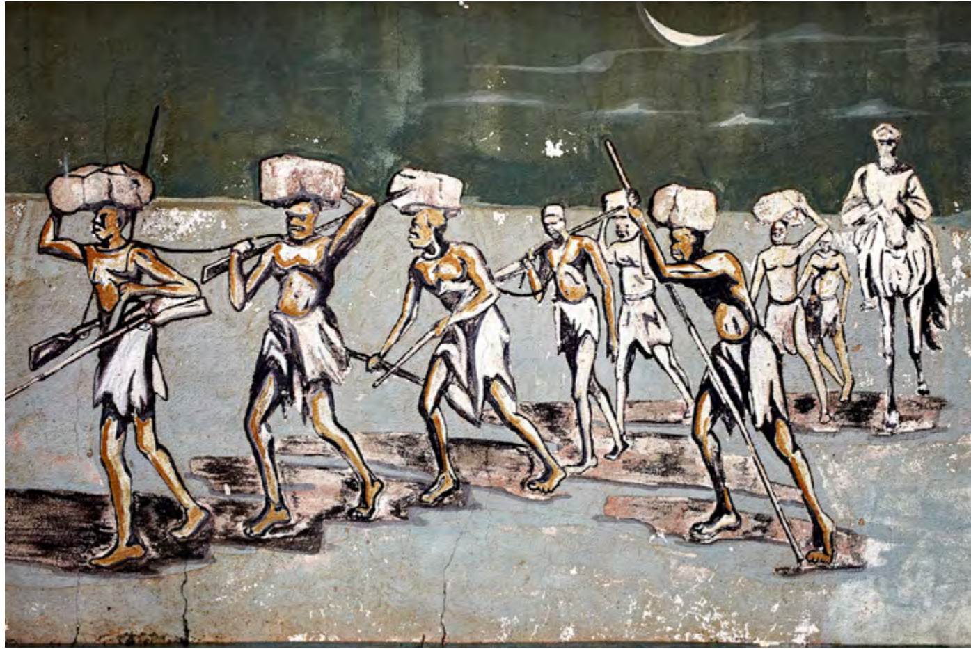
Un convoi de captifs aux environs de Kita, 1863-66, Koulouba, Bamako, Mali, 2015, Mali Militari series © François-Xavier Gbré