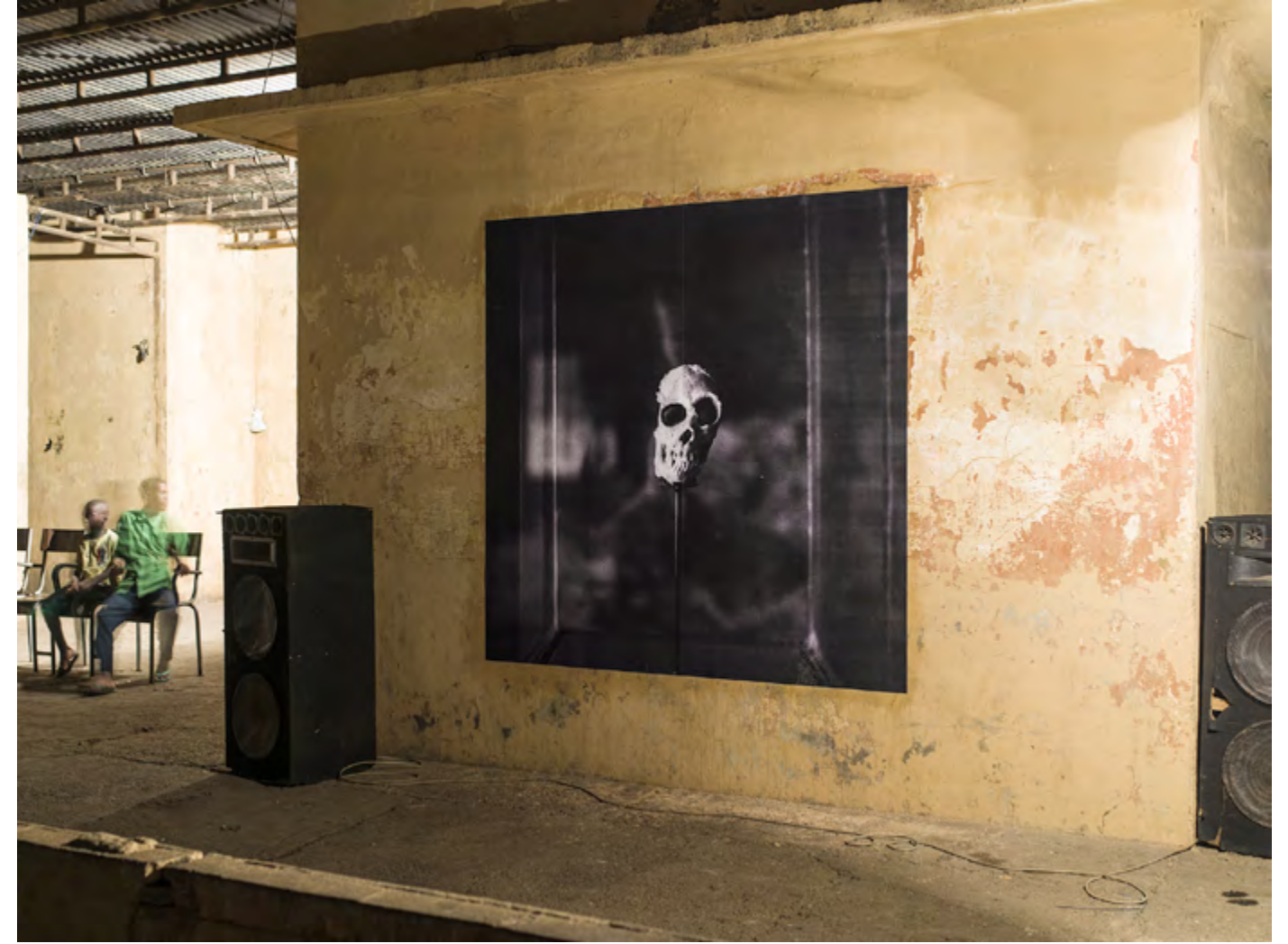
Le crâne de Toumaï, 2007, photographie argentique, Bamako, Mali Vue de l'installation au / Installation view at Cinema El Hilal, Medina Coura, Bamako, Mali, 2017