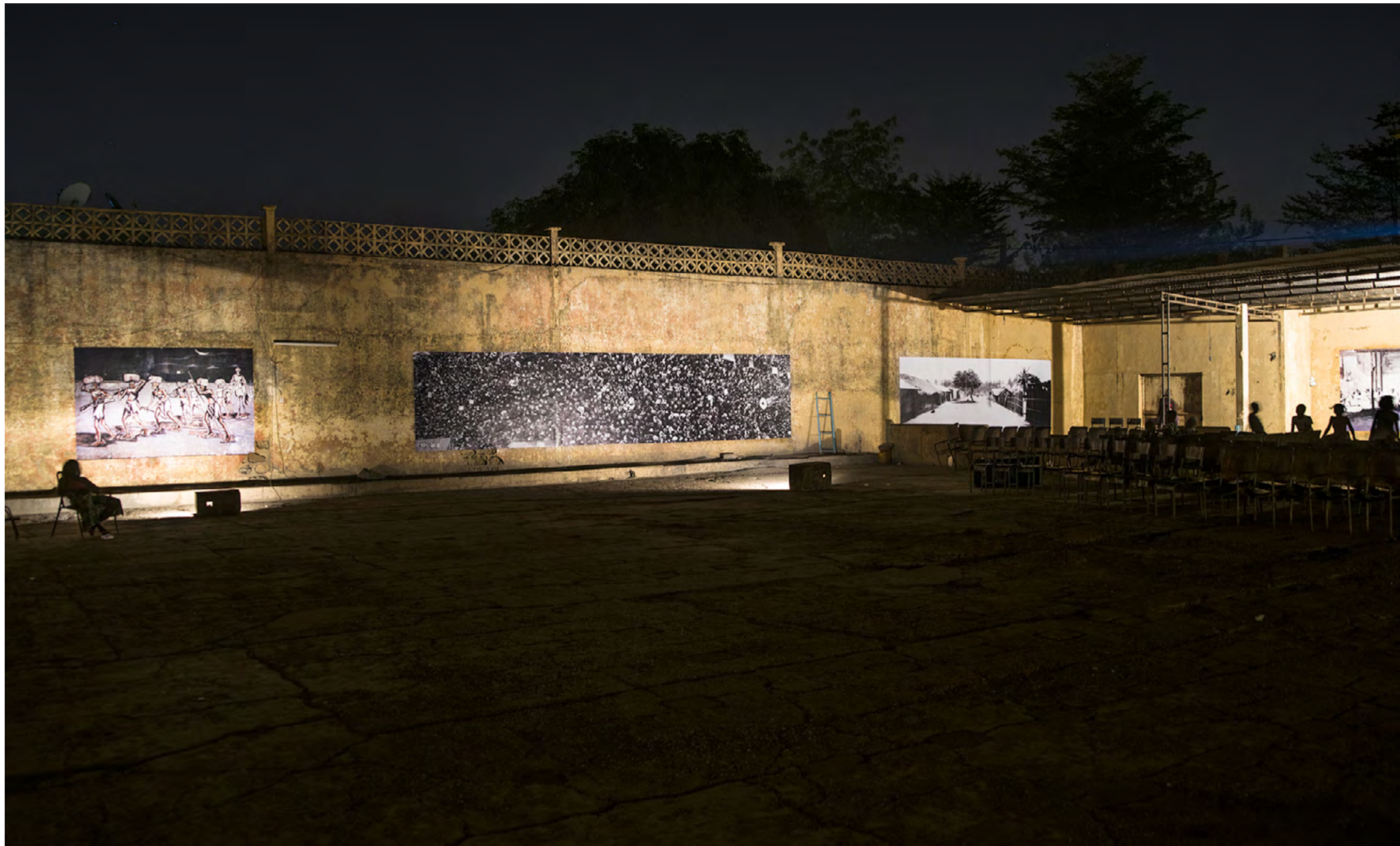
Un convoi de captifs aux environs de Kita (1863-66) , Koulouba, Bamako, Mali, 2015, Mali Militari series © François-Xavier Gbré