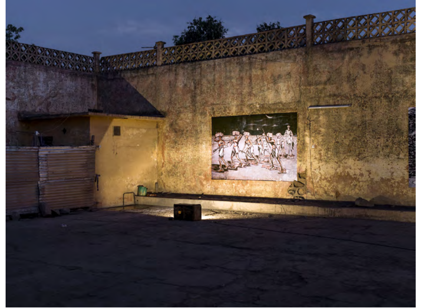
Un convoi de captifs aux environs de Kita , (1863-66), Koulouba, Bamako, Mali, 2015, Mali Militari series

Vue de l'installation au / Installation view at Cinema El Hilal, Medina Coura, Bamako, Mali, 2017