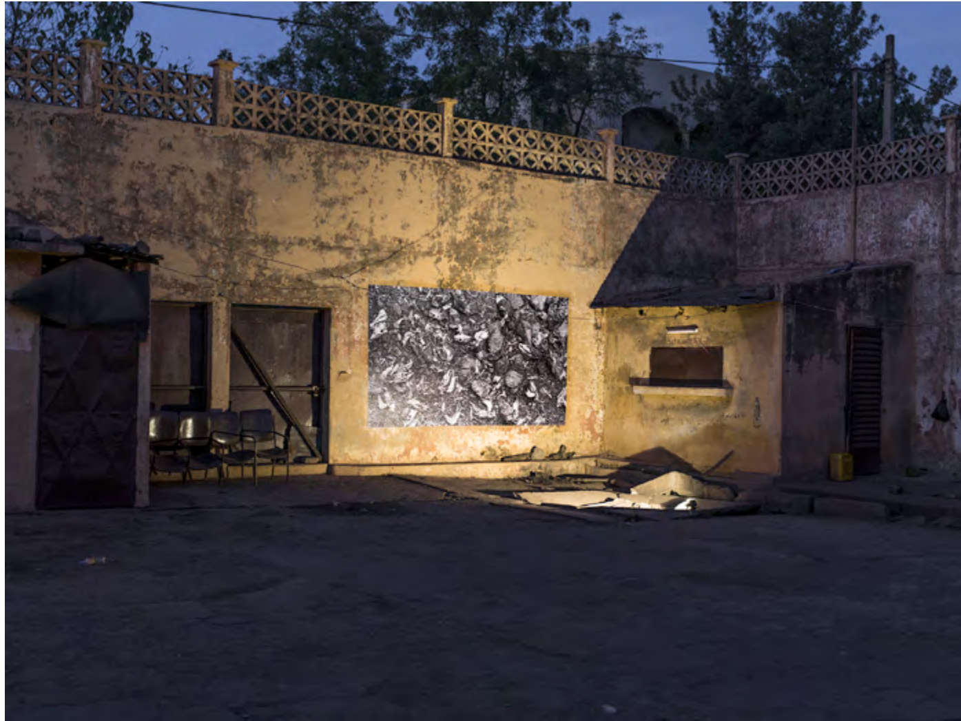
Des ânes et des lions , 2007, photographie argentique, Bamako, Mali