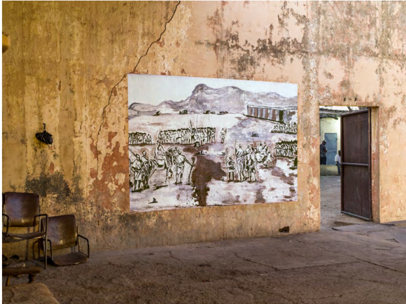
Bataille de Sansanding, 1865, Koulouba, Bamako, Mali, 2013, Mali Militari series © François-Xavier Gbré Vue de l'installation au / Installation view at Cinema El Hilal, Medina Coura, Bamako, Mali, 2017